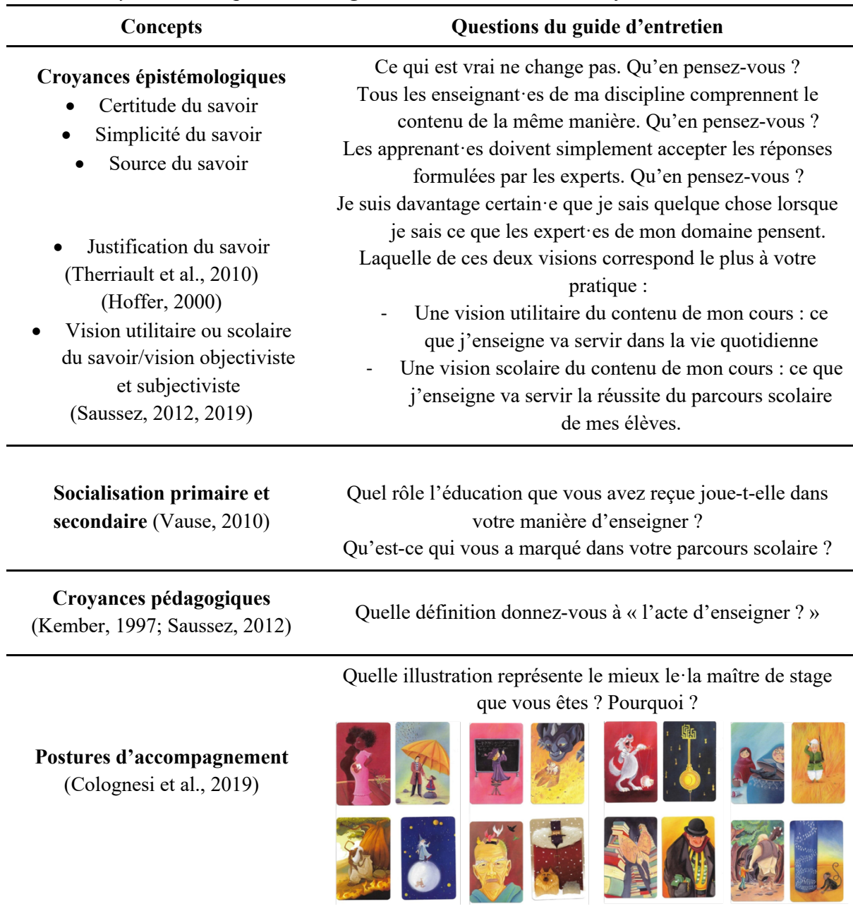
Tableau de synthèse des questions du guide d'entretien semi-directif